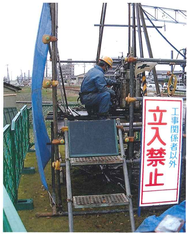
図-2 ボーリング仮設図