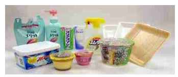
容器包装プラスチック